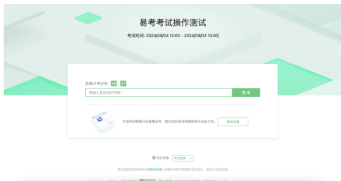
图 4 考核口令页

请注意：正式考核与模拟测试的口令不同，请应考人员注意查看中总协相关通知，以免因使用错误口令导致错过考核。