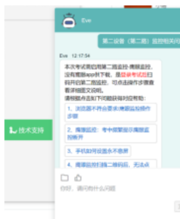
图 16 技术支持示意图