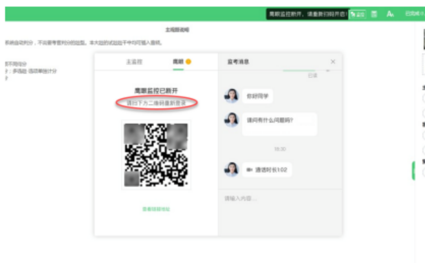
图 15 鹰眼监控断开示意图

报考人员点击考核界面上方功能区中的“监控”图标, 用第二视角监控设备扫描二维码重新连接鹰眼监控。在监控画面恢复后, 立即将第二视角监控设备重新摆放到监控点位上。