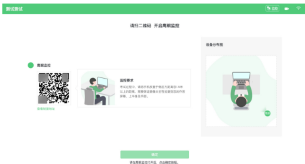
图 10 鹰眼登录