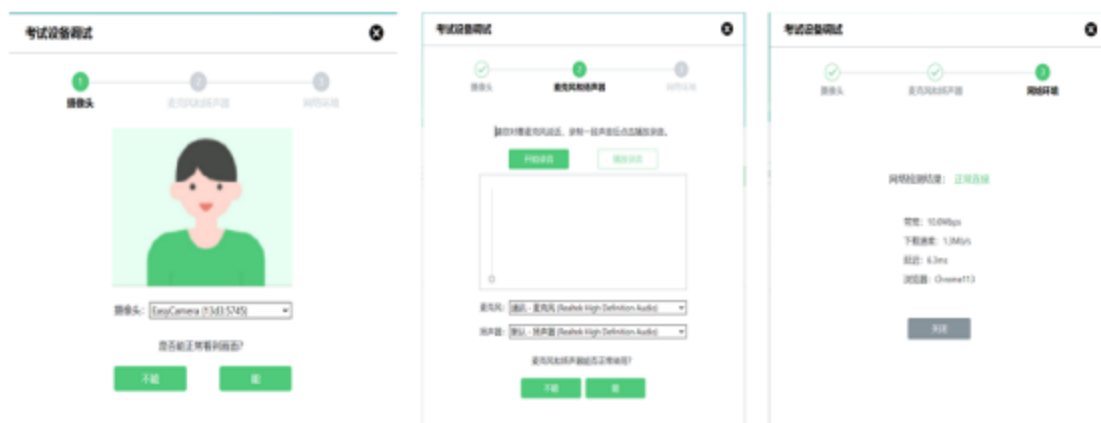
图 6 设备调试 2

请注意：一旦完成登录，考核系统将全屏锁定电脑的操作界面。强烈建议在输入身份证件号进入考核前，进行设备调试，确认考核设备的可用情况。