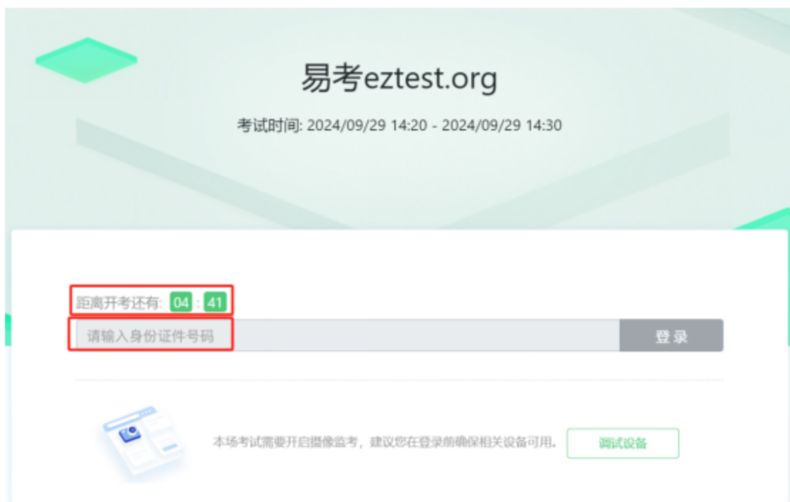
图 5 设备调试 1

请注意：一旦完成登录，考核系统将全屏锁定电脑的操作界面。强烈建议在输入身份证件号进入考核前，进行设备调试，确认考核设备的可用情况。