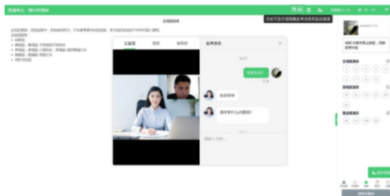
图 14 视频通话示意图