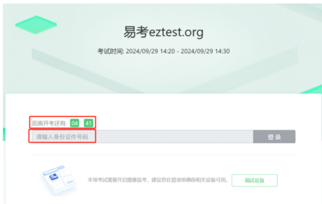
图 7 考核登录

完成调试后，可在允许登录的时间段内（登录时间等要求请参见中总协相关通知），输入身份证号码登录。建议应考人员预留出时间，提前完成设备调试，提前进入考核。