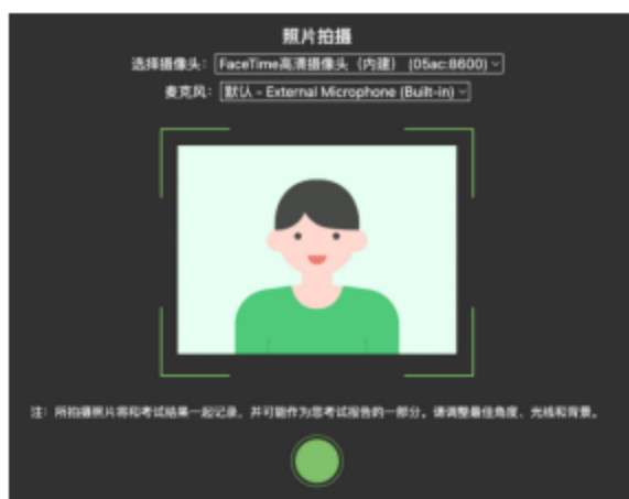
图 9 拍摄登录照

登录照片是中总协核验应考人员身份的重要凭证之一，请确保拍照时光线充足、图像清晰，照片应包括应考人员完整的面部和肩部。