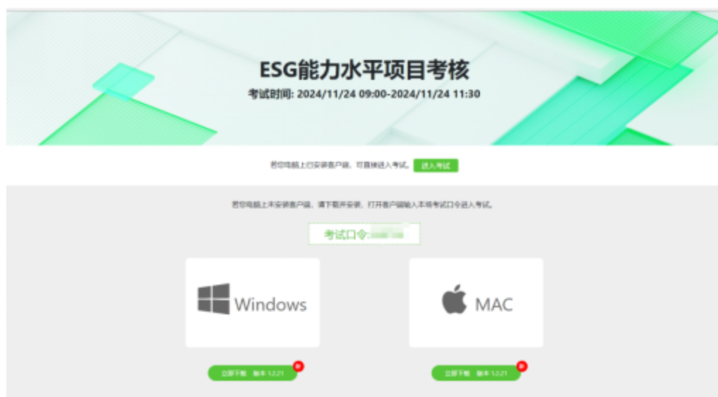
图 3 易考客户端下载

2、请报考人员根据自己考核设备的操作系统类型（Windows 或 Mac），下载对应的客户端安装包。