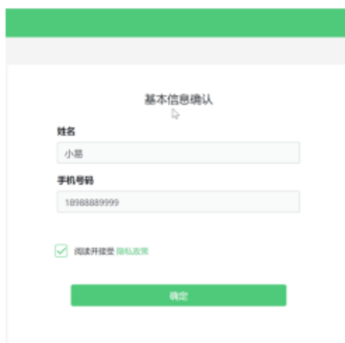
图 8 基本信息确认