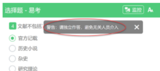
图 13 监考老师发送信息示意图

监考老师发送的信息，将出现在答题界面中，可点击右上角的“监控”图标进一步查看详情。