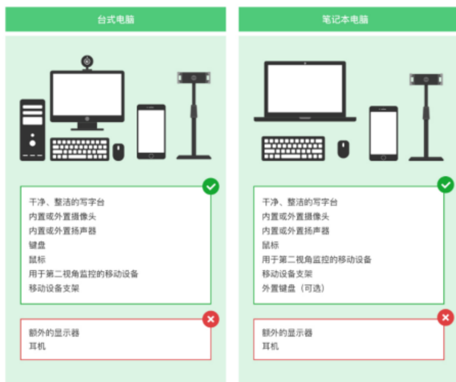
图 1 考核设备要求