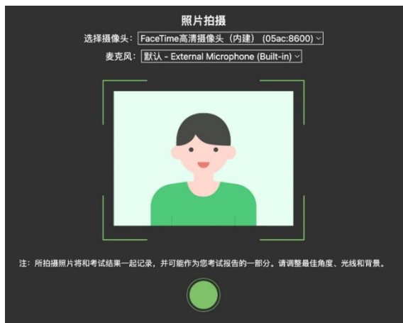
图 9 拍摄登录照

登录照片是中总协核验报考人员身份的重要凭证之一，请确保拍照时光线充足、图像清晰，照片应包括报考人员完整的面部和肩部。