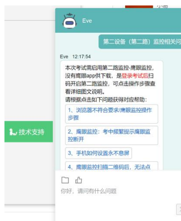
图 16 技术支持示意图