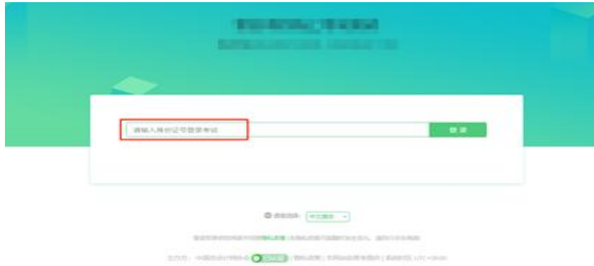
图 8 基本信息确认