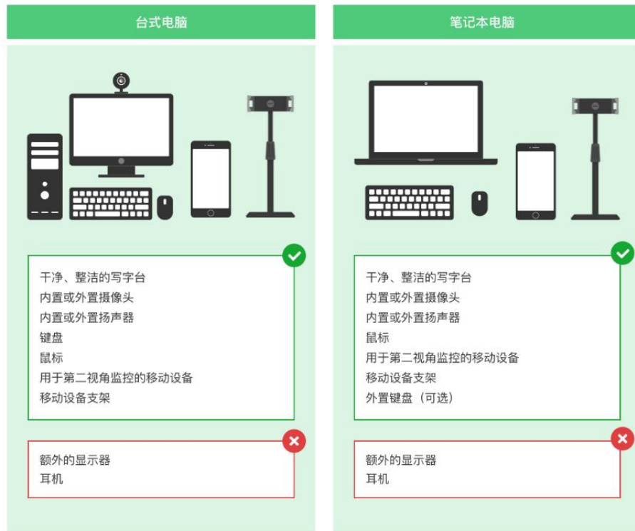
图 1 考核设备要求