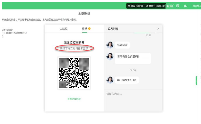
图 15 鹰眼监控断开示意图

应考人员点击考核界面上方功能区中的“监控”图标, 用第二视角监控设备扫描二维码重新连接鹰眼监控。在监控画面恢复后, 立即将第二视角监控设备重新摆放到监控点位上。