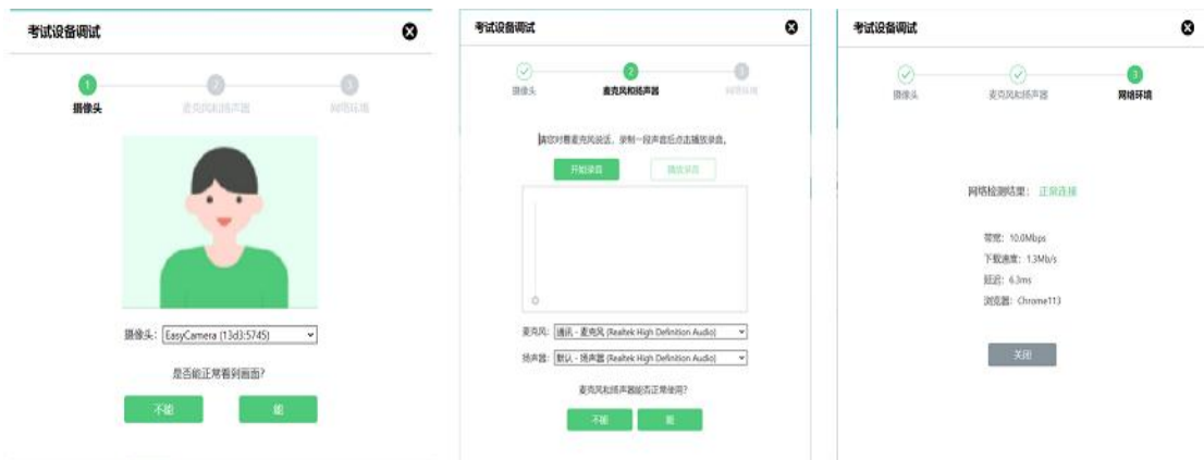
图 6 设备调试 2

请注意：一旦完成登录，考核系统将全屏锁定电脑的操作界面。强烈建议在输入身份证件号进入考核前，进行设备调试，确认考核设备的可用情况。