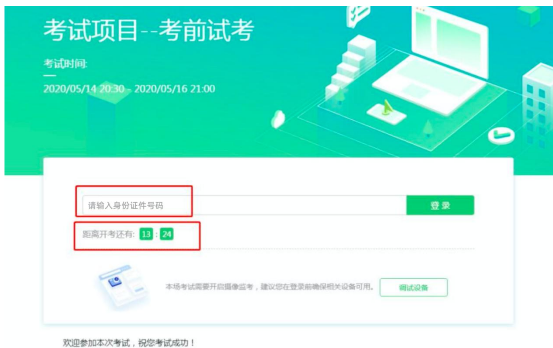
图 7 考核登录

完成调试后，可在允许登录的时间段内（登录时间等要求请参见中总协相关通知），输入身份证号码登录。建议应考人员预留出时间，提前完成设备调试，提前进入考核。