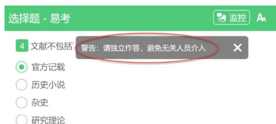
图 13 监考老师发送信息示意图

监考老师发送的信息，将出现在答题界面中，可点击右上角的“监控”图标进一步查看详情。