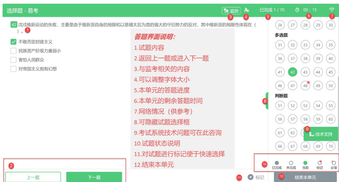
图 12 答题界面