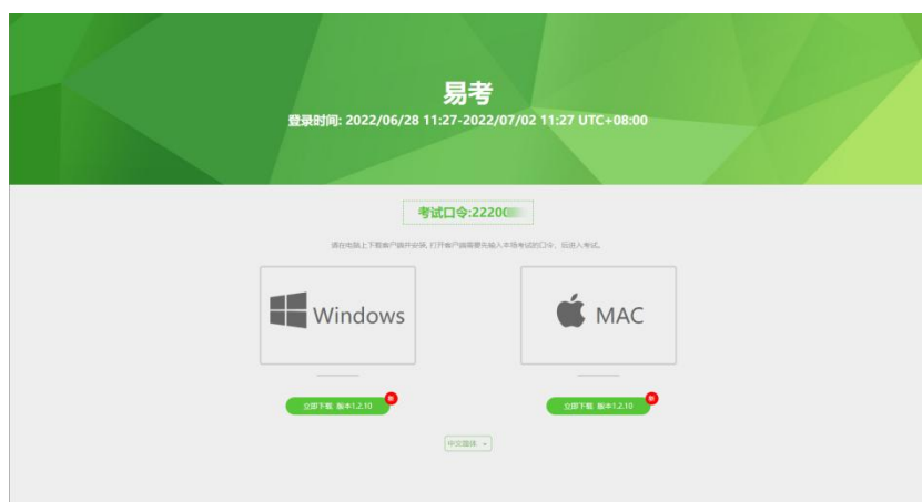
图 3 易考客户端下载

2、请应考人员根据自己考核设备的操作系统类型（Windows 或 Mac），下载对应的客户端安装包。