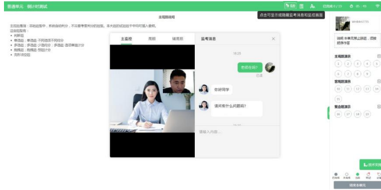
图 14 视频通话示意图