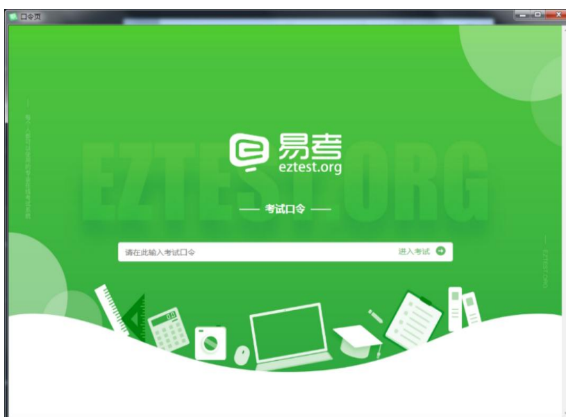
图 4 考核口令页

请注意：正式考核与模拟测试的口令不同，请应考人员注意查看中总协相关通知，避免因使用错误口令导致错过考核。