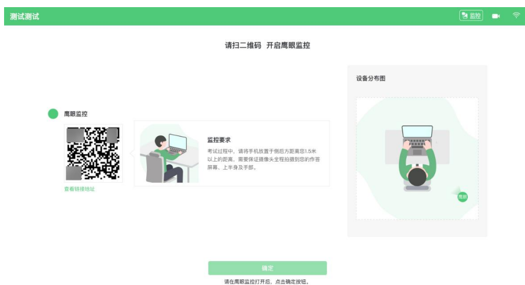
图 10 鹰眼登录