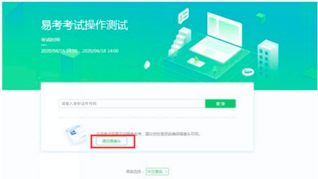
图 5 设备调试 1

请注意：一旦完成登录，考核系统将全屏锁定电脑的操作界面。强烈建议在输入身份证件号进入考核前，进行设备调试，确认考核设备的可用情况。