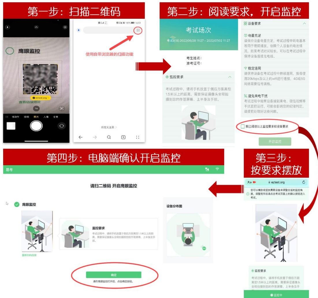
图 11 开启鹰眼步骤图